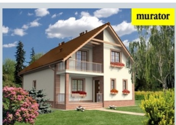
Вид со стороны входа