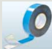
DELTA®-DUO TAPE 38