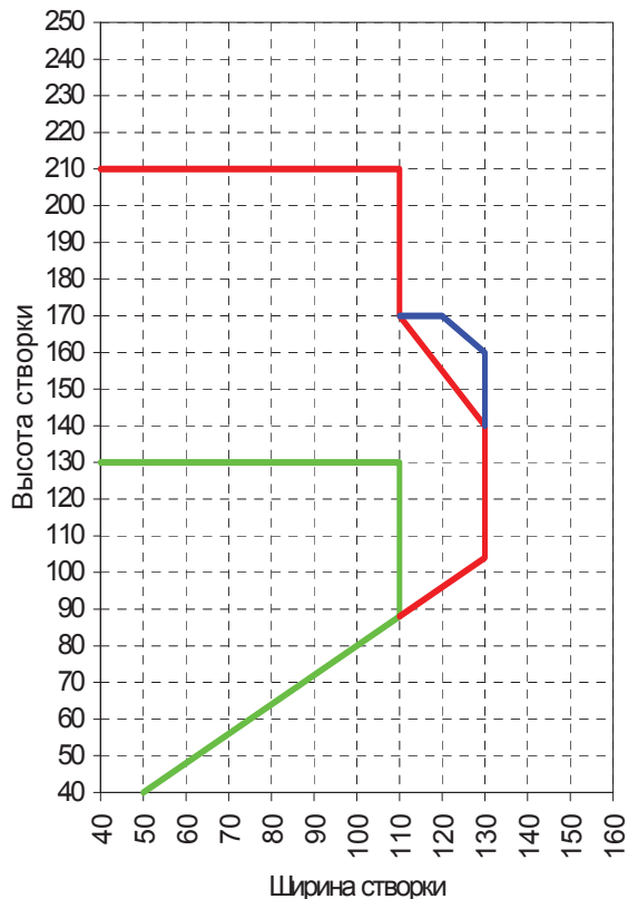
Обозначение цветом (для белых профилей)

Односторчатое поворотное/пов.-откидное Цвет: цветные профили Группа нагрузки A/B/C