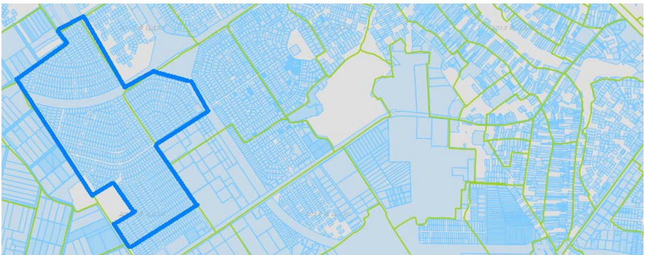
Схема розміщення частини території села Софіївська Борщагівка на кадастровій карті

На цій території розміщено більше 1000 земельних ділянок (кадастрові номери 3222486200:03:004:5001 ... 3222486200:03:004:6051; 3222486200:03:007:5035 ... 3222486200:03:007:5203).