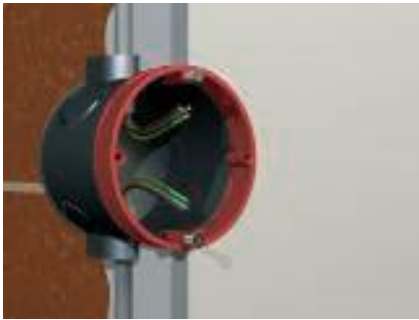
Указание по установке В

Если штукатурка на стене толще, на монтажные коробки одеваются специальные выравнивающие кольца.