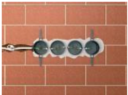
Установка монтажных коробок

Зафиксированные в стене монтажные коробки готовы к установке электротехнических изделий.