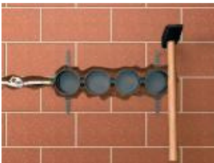
Указание по установке E

Монтажные коробки с фиксаторными лапками можно предварительно фиксировать на проблемных участках стены.