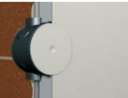
Указание по установке D

После установки монтажные коробки можно просто закрыть с помощью пружинной крышки.