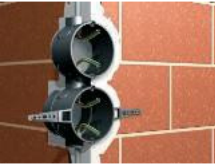
Указание по установке А

Просверлить необходимые отверстия в стене, заполнить их гипсовым раствором и вставить монтажную коробку.